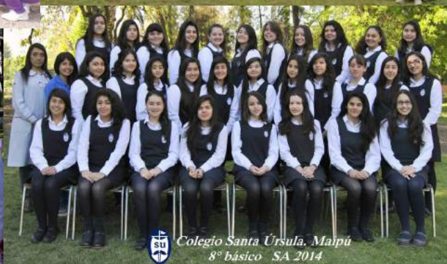
Colegio Santa Úrsula, Maipú 8° básico SA 2014