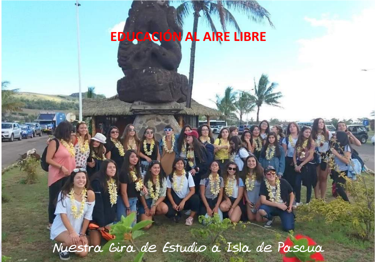
Nuestra Gira de Estudio a Isla de Pascua